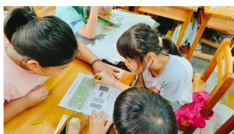
桌上遊戲：豬肉保衛隊大冒險