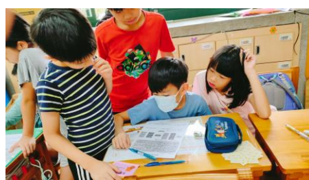
豬肉保衛隊大冒險任務解題